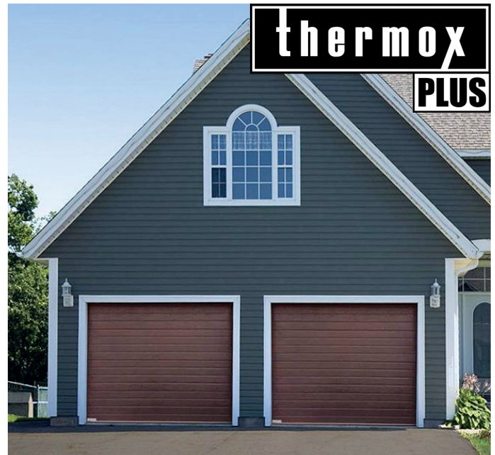
Thermox Plus 2500 x 2125 ruskeat vaakaura nosto-ovet.