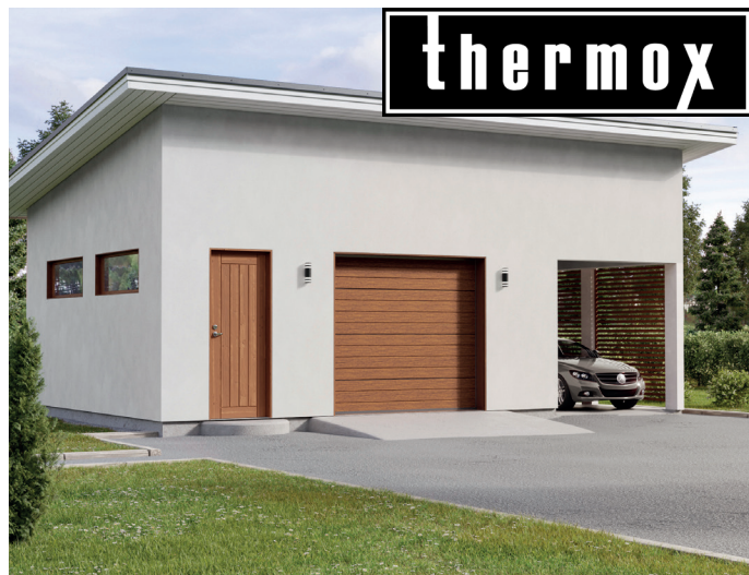
Thermoxin 2500 x 2150 vaakaura nosto-ovi puukuviolla.

Ovimalli, jota olemme vuosien varrella myyneet jo tuhansia kappaleita. Thermox ovi on yksi markkinoiden edullisimmista ja helppokäyttöisimmistä nosto-ovista. Tämä ovimalli on tarkoitettu erityisesti kylmiin ja puolilämpimiin talleihin. Uudistetussa mallissa oven eristepaksuutta on lisätty ja näin energiatehokkuutta on saatu paremmaksi. Oven sisä- ja ulkopinta ovat iskunkestävää polttomaalattua terästä. Ovipaneelin vahvuus on 40 mm ja se on eristyskyvyltään erittäin hyvä. Kaikkien nosto-ovien tilaaminen onnistuu helposti nettikaupastamme.